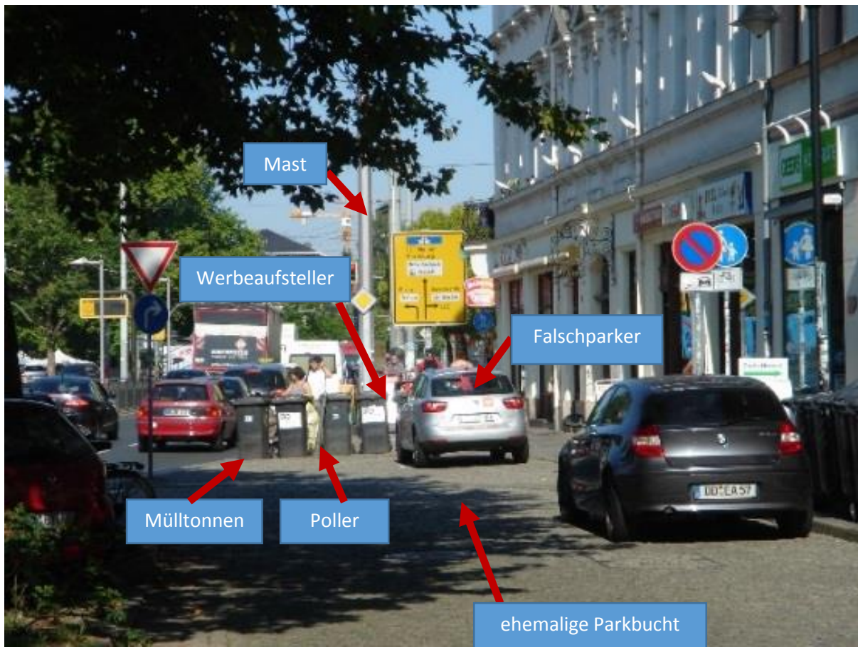
Abb. 4 Situation derzeit (Mündung Alaunstraße, ca. Juli 2014)